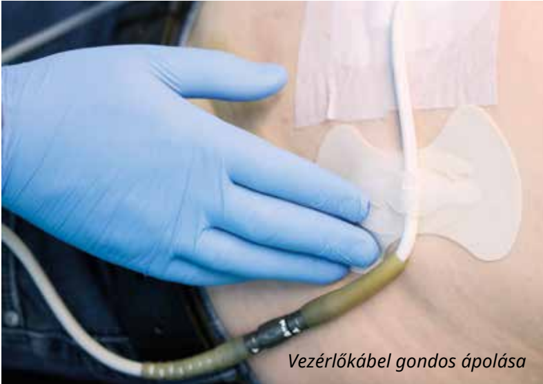
Vezérlőkábel gondos ápolása

Az ápolás szabályairól bővebben a betegkézikönyvben olvashat, valamint segítséget kérhet a kötözésért felelős ápolóinktól.